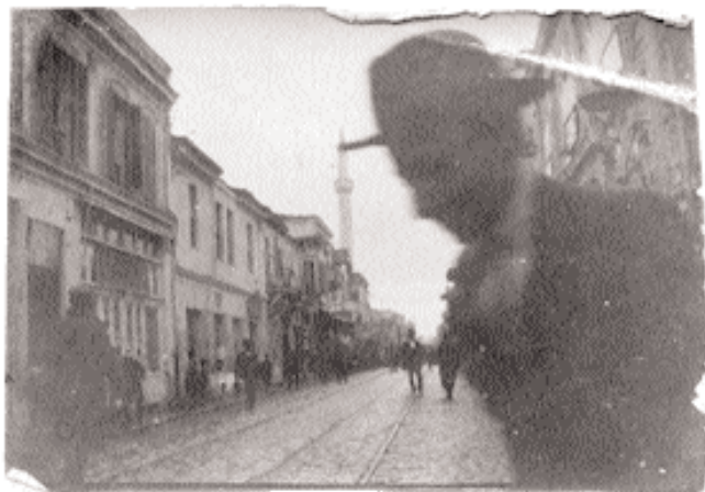
Salonique, rue Egnatia, octobre 1915

En hommage à tous les membres de ma famille qui ont permis ce travail de mémoire et d'imaginaire.