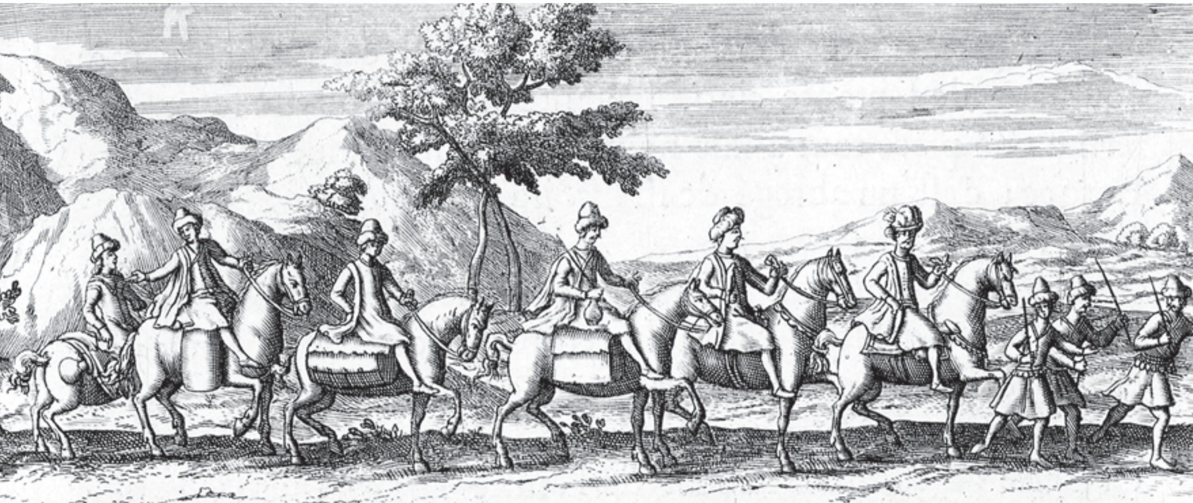
Dignitaire et son équipage sur la route d'Espaban.