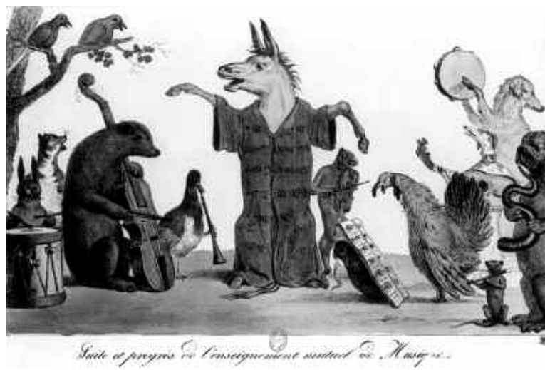
CM, Suite et progrès de l'enseignement mutuel de Musique