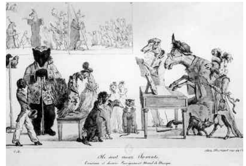
CM, Ils sont assez Savants. Troisième et dernier Enseignement Mutuel de Musique