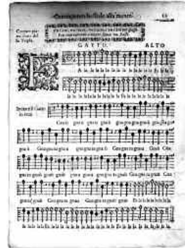
Adriano Banchieri, Contraponto bestiale , Festino, 1608

Une estampe française, à peu près contemporaine du charivari de Molière et Charpentier et intitulée Concert mélodieux (B.N. Est., Kd3 fol., t. II, M 30069), montre dans un décor de village un joueur de triangle, un vieilleux, un Turc (?), deux enfants, un âne, une truie, un estropié joueur de trompe (?) et quatre chats en l'air, devant une grande partition où l'on peut lire : hoïn hoïn, hin haa, mia oo . Ce genre d'amusement a traversé les siècles. Un médaillon gravé d'époque napoléonienne, intitulé Concert d'amateurs , montre une oie qui chante, accompagnée par un chat violoniste, un aigle claveciniste et un chien violoncelliste (B.N. Est., Tf5 pet. fol. p. 13 ; reproduit dans Raabe, t. I, p. 352, avec datation erronée) ; un autre exemple gravé sur bois avec chien, chatte et singe est reproduit ibid. , p. 217. On retrouve un orchestre d'animaux,