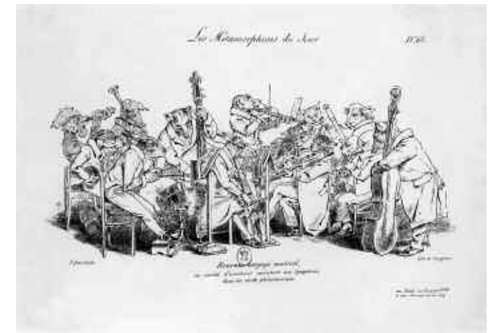
Grandville, Nouveau langage musical , 1828-29