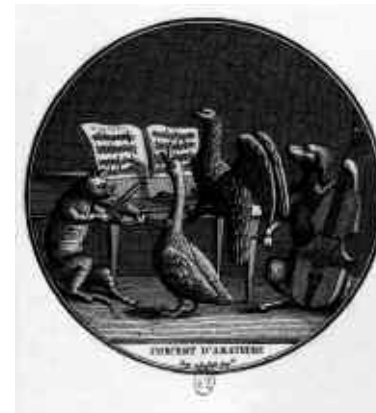
Concert d'amateurs , début XIX e s.