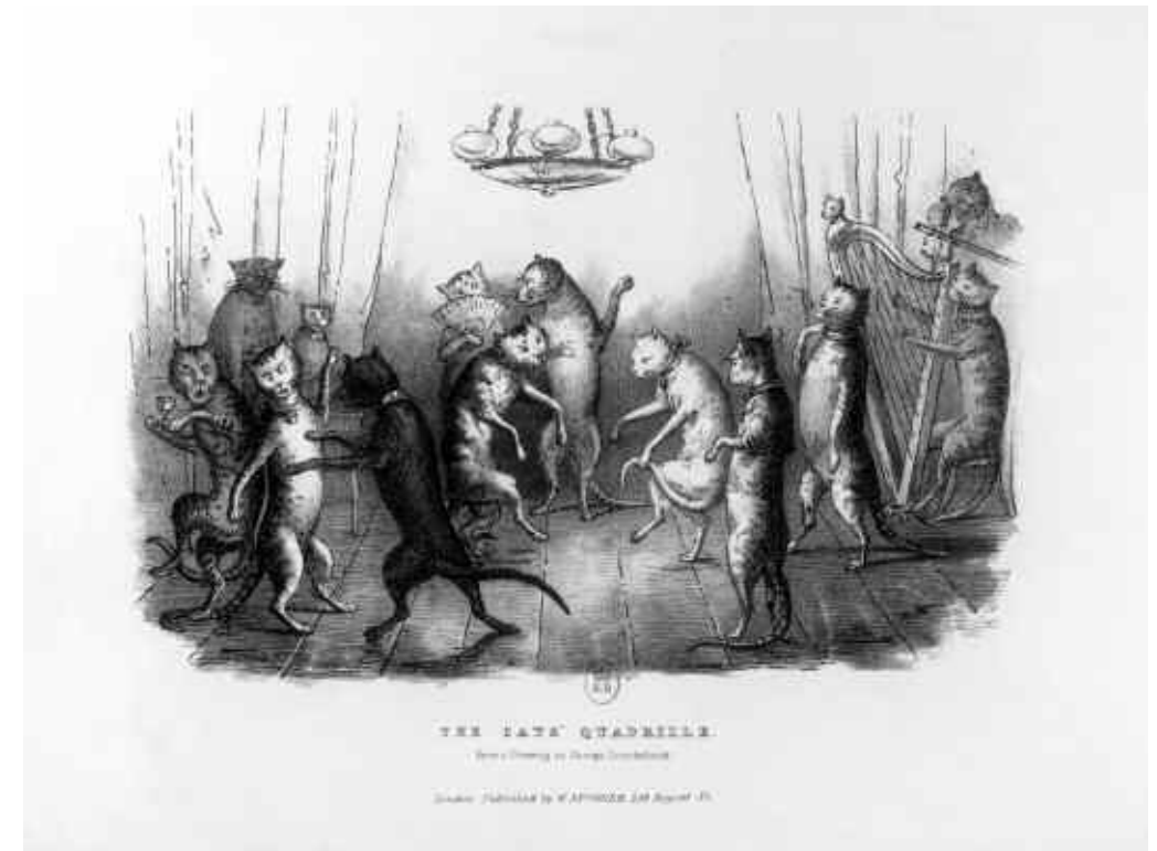
George Cruikshank, Le quadrille des chats