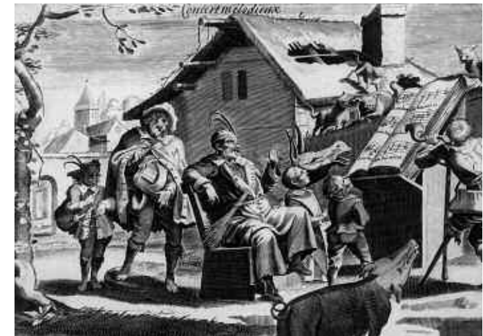
Concert mélodieux , XVII e s.