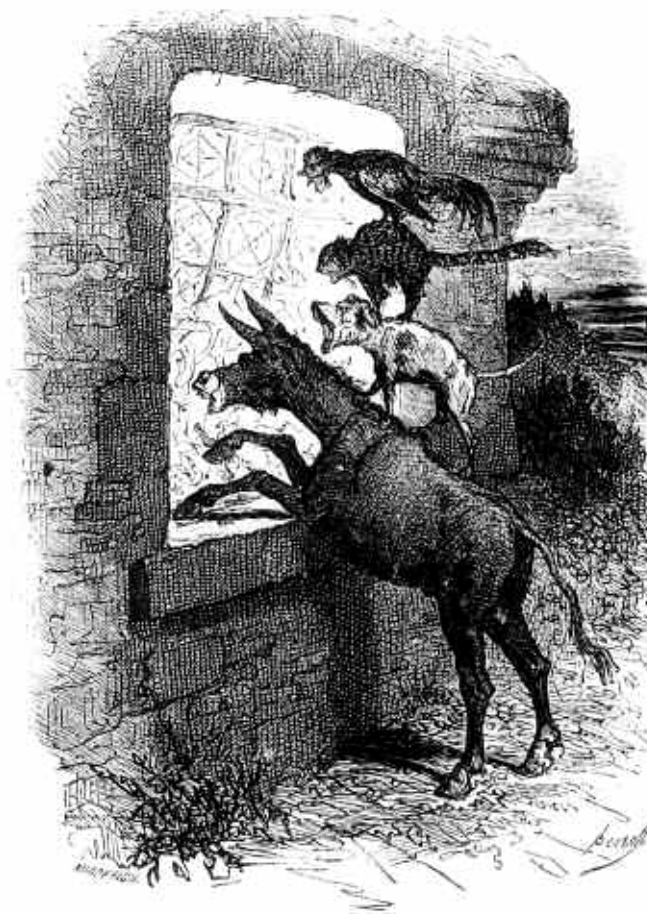
Bertall, Les Musiciens de Brême , 1855

avec trois chats jouant de la flûte, du violon (et de l'alto ?), dans la planche 66 des Métamorphoses du jour de Grandville (1828-29), sous le titre « Nouveau langage musical, ou société d'amateurs exécutant une Symphonie, dans un cercle philharmonique ». Un groupe de quatre lithographies signées CM (B.N. Est., Kd3 fol., t. II, M 30096 à 99) illustre aussi des concerts d'animaux : l'une d'elles, intitulée Enseignement mutuel du Chant , montre un âne dirigeant une chorale de chats, chiens, oies et dindons ; une autre, Suite et progrès de l'enseignement mutuel de Musique , montre le même âne dirigeant un orchestre animal (sans chats) ; la dernière, Le Concert interrompu , figure entre autres un chat qui pète violemment. Enfin, un conte des frères Grimm, « Les musiciens de la ville de Brême », met en scène un âne, un chien, un chat et un coq, dont le concert en quatuor met en fuite une troupe de brigands ; une planche de Bertall illustre la scène dans l'édition Hachette des Contes choisis des frères Grimm (1855).