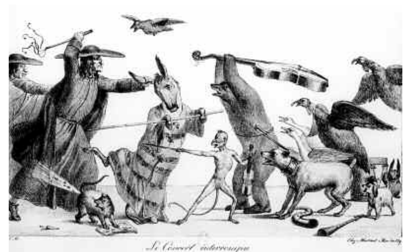
CM, Le Concert interrompu