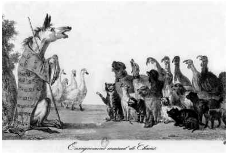
CM, Enseignement mutuel du Chant, v. 1830