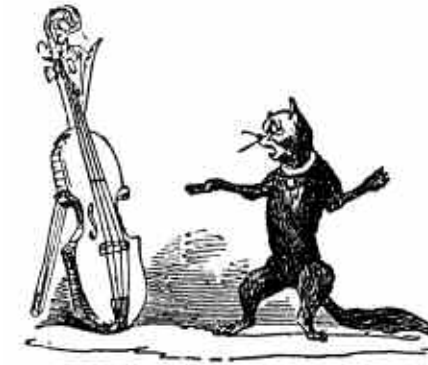
George Cruikshank, My Uncle !